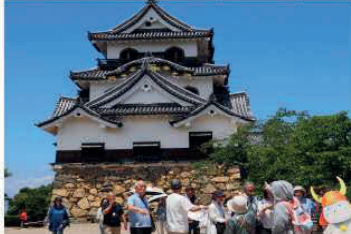
6.17 彦根城・長浜城・長浜黒壁スクエア(バス旅行)